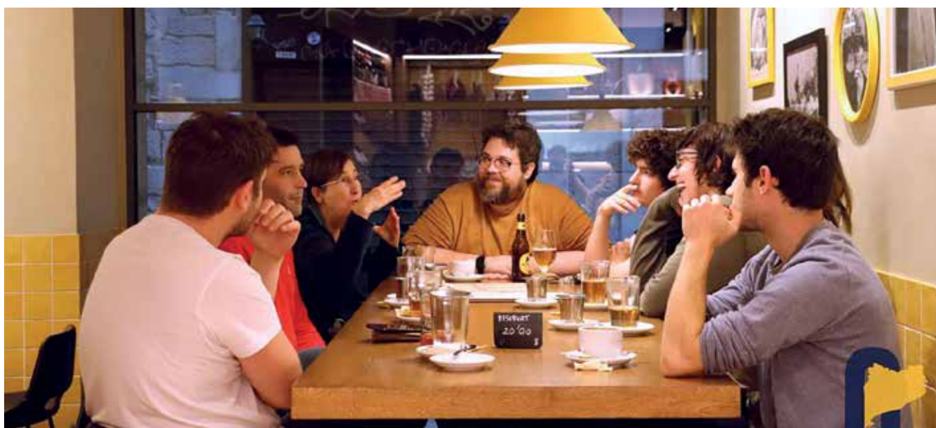
Fotografia d'una de les sessions del Cafè filosòfic de Girona a la Taverna d'El Foment.

Un altre participant va plantejar que el desenvolupament de la filosofia està actualment bloquejat per les xarxes socials i els mòbils. Els temes que s'hi tracten acostumen a ser superficials i consensuats, cosa que impedeix una investigació més profunda i personal. La filosofia requereix temps, espai i vo-