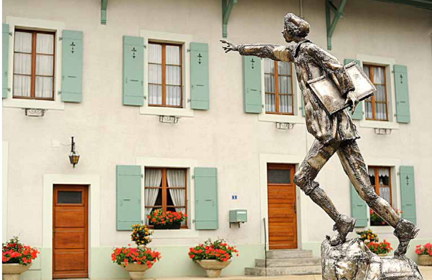
Estàtua de l'adolescent Jean-Jacques Rousseau al poble de Bossey.

gi de tornar a un hipotètic estat original i primigeni, més aviat el que fa és posar èmfasi en què la societat, en els termes que ha estat fundada és un error i, per aquesta línia insinua que s'hauria de fundar una nova manera de viure sobre uns altres fonaments, més encertats i escaients a l'home, perquè hi pogués esdevenir una veritable conquesta de la seva felicitat.