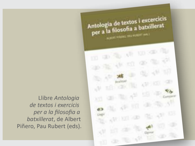
Libre Antologia de textos i exercicis per a la filosofia a batxillerat , de Albert Piñero, Pau Rubert (eds).

Tot seguit es va presentar la pàgina web de l'Equip amb tots els continguts didàctics i els cursos elaborats durant aquests deu anys. Es va parlar especial atenció a les "píndoles", unes fitxes didàctiques pensades per fer en una sessió sense la presència del professorat de filosofia necessàriament, organitzades per temes i procediments o tipus. Podeu consultar la pàgina: https://sites.google.com/view/equipcedefilosofia